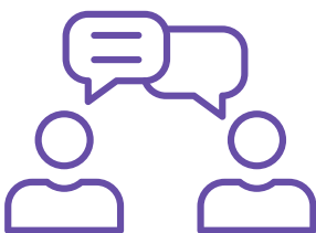
Communication et collaboration