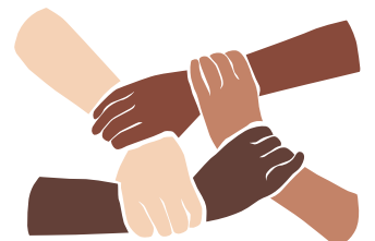
Diversité, équité et inclusion