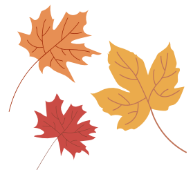
Enseignement en plein air