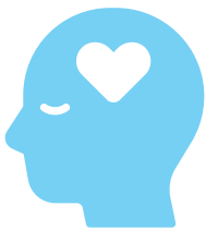
Santé mentale et bien-être